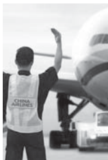
एजेन्सी गुवाहाट (बीना), भदौ २४

हुई इजरायली कम्पनीले बुईबटा विनिर्माण कम्पनीसँग विकास र अनुसन्धान तथा हवाईजहाज उत्पादनका लागि सहकार्य गर्ने भएका छन्। दुई देशका कम्पनीहरूले दक्षिणपश्चिम चीनको गुञ्जोको प्रान्तमा विमान निर्माण तथा अनुसन्धान र विकासका लागि सहकार्य गर्ने समझौता गरेको सिन्धुवाले जनाएको छ। सोमबार