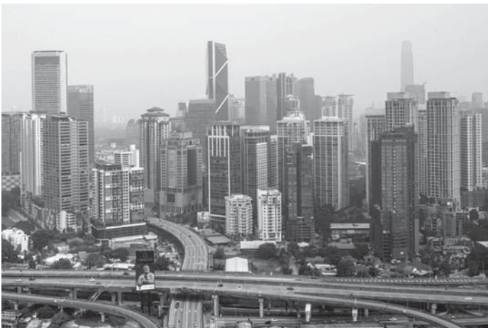
मलेसियाको राजधानी क्वालालम्पुरको आकाशमा मंगलवार देखिएको हुँदाले। मलेसिया र इन्डोनेसियाको जंगलमा लागेको बढेको अनियन्त्रित भएपछि सयौं स्कुलहरू बन्द गरिएका थिए। विषालु ग्यास रहेको कारण अधिकारीहरूले विद्यालय बन्द गरेको बताएका छन्।