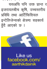
Like us facebook.com/aarthikdaiik

सहआपि पनि उक्त प्रकृत र इजरायलीय कृषि, उच्चस्तरीय प्रविधि तथा आर्टिफिशियल इन्टेलिजेन्सको क्षेत्रमा सहकार्य हुँदै आएको छ।