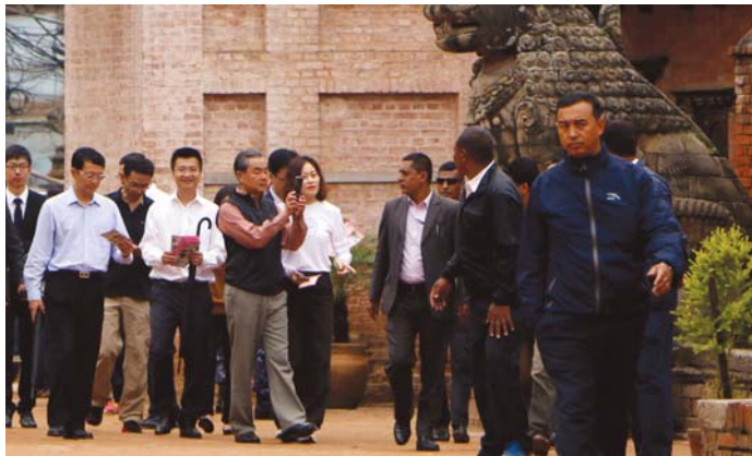
विनियार् विदेशमन्त्री बाइर वी भक्तपुरमा : नेपाल ग्रामपंचायत रहुनुभएका विनियार् विदेशमन्त्री बाइर वी भक्तपुर भक्तपुर दरवार क्षेत्र अवलोकन गर्दै ।